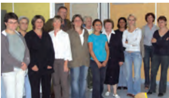
Journée "portes ouvertes" à la crèche halte-garderie