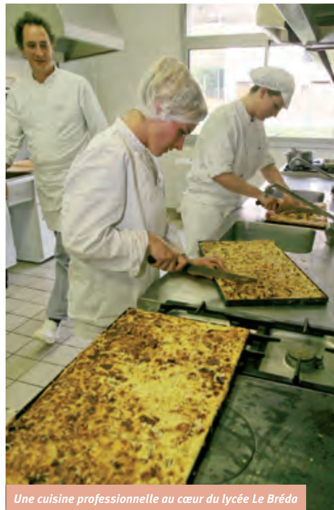
Une cuisine professionnelle au cœur du lycée Le Bréda

L'école municipale de musique d'Allevard accueille, cette année, 162 élèves. Sept instruments sont enseignés dans cette école: la flûte, la clarinette, le saxophone, le hautbois, le piano, les cuivres et percussions et, depuis la ren-