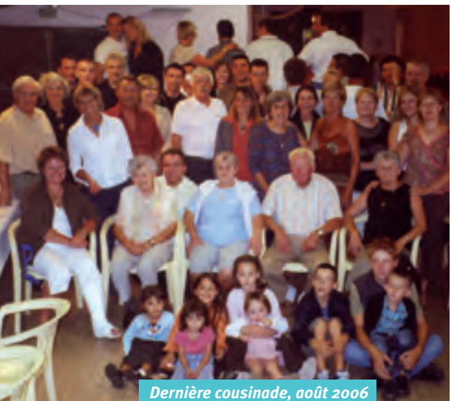
Dernière cousinade, août 2006

Au siècle dernier, les réunions de famille étaient monnaie courante : les enfants ne partaient jamais bien loin de leurs parents et il était aisé de rassembler le clan autour d'une table, pour une occasion ou pour une autre.