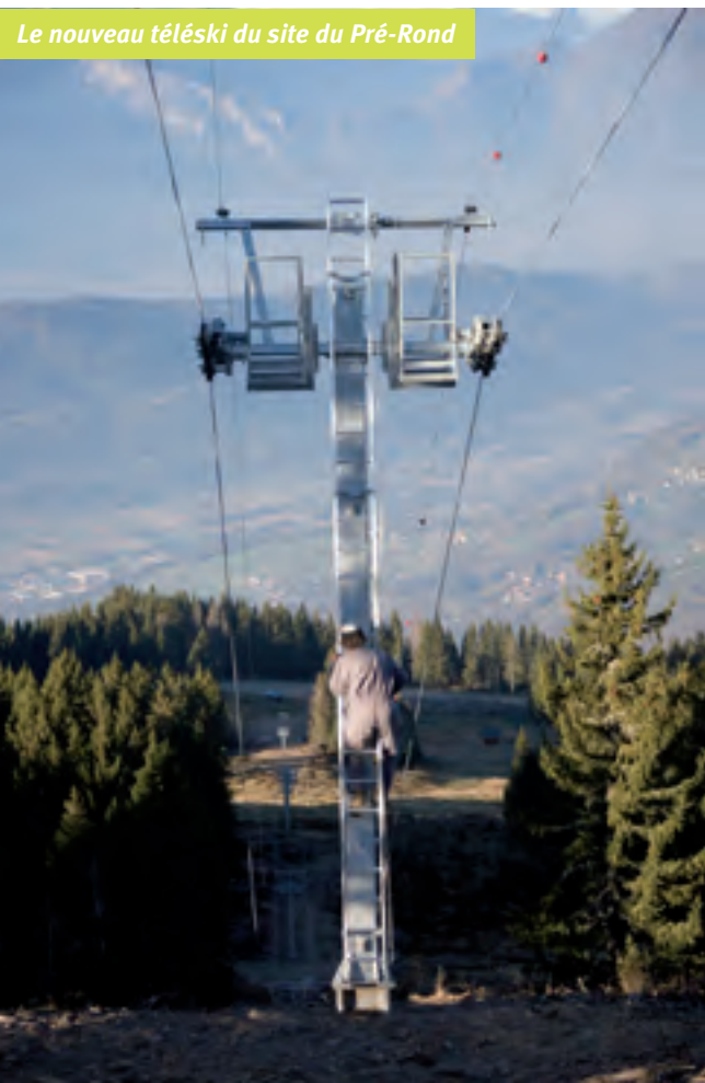
Le nouveau téléski du site du Pré-Rond