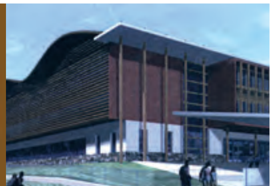
La salle Casserra, le centre de secours, le collège, trois grands projets qui s'imposent avec urgence