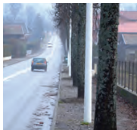
Le trottoir du Boulevard des Anciens d’Algérie sera recouvert d’un evergreen

Un grand chantier de voirie est engagé pour ce boulevard. Le trottoir de droite en direc-