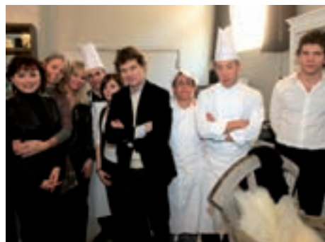
L’équipe du Trianon