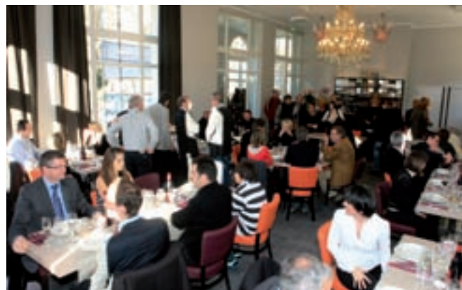
Le Trianon inauguré le 11 décembre dernier