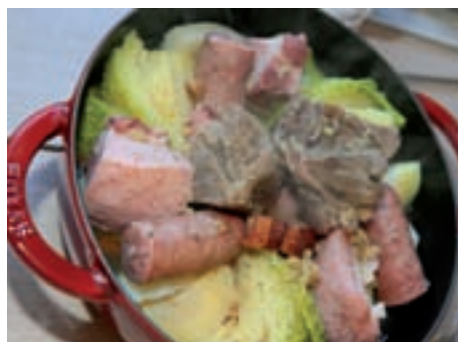
Une carte conçue à partir de produits régionaux

Un lieu beau et agréable, accessible, avec une carte proposée par l’un des plus grands chefs français. Un rêve d’enfant pour Guy Martin et Brigitte Lacroix, un beau moment de rêve pour les clients en perspective. ■