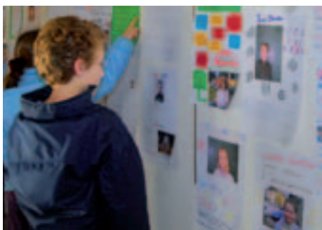
Les jeunes électeurs lisent les professions de foi des candidats

Le premier conseil municipal d'enfants a fait aménager une piste de VTT/BMX, a contribué à la rénovation du skate-park, a participé au Téléthon et à des échanges intercommunaux avec les autres conseils municipaux d'enfants du département.