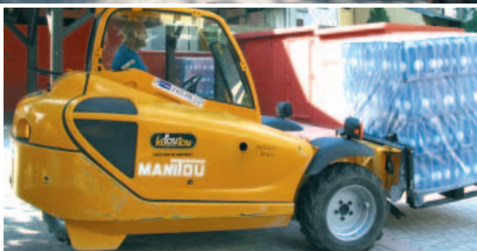
Du 23 au 25 août, les habitants ont reçu trois litres d'eau par personne, soit environ 40 000 bouteilles au total.

Dans la matinée du 23 août 2005, l'eau du robinet se trouble, une réunion est alors organisée en Mairie avec les représentants de la Générale des Eaux. Une question importante est sur toutes les lèvres : comment peut-on assurer la distribution de l'eau aux Allevardins ? La Générale des Eaux propose de mettre à disposition de la commune une partie de sa réserve d'eau en bouteille pour procéder à une distribution le jour même. Un message téléphonique enregistré est diffusé à la mi-journée à tous les abonnés de la Générale des Eaux. Allevard est une ville touristique et il nous fallait également informer