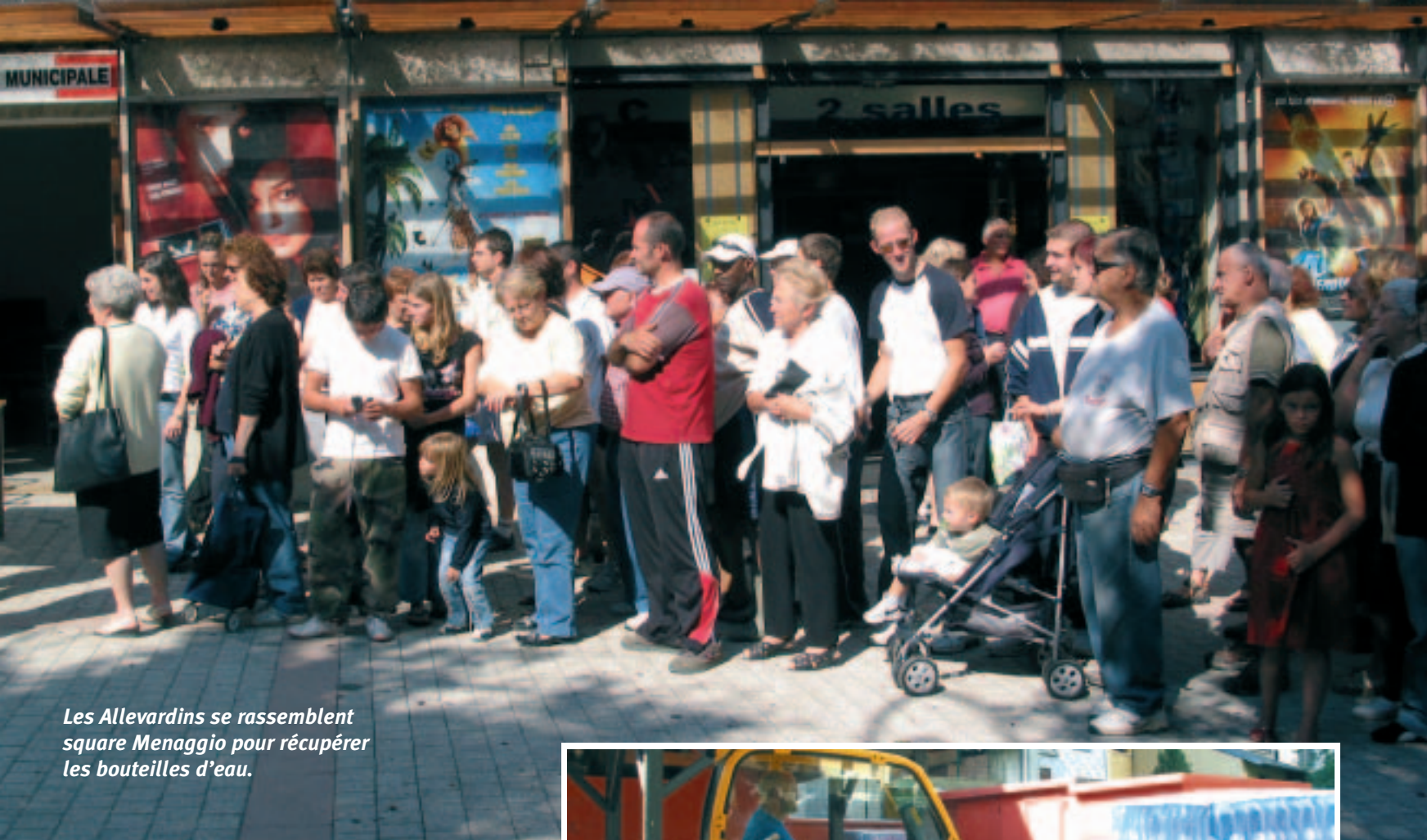
Les Allevardins se rassemblent square Menaggio pour récupérer les bouteilles d'eau.