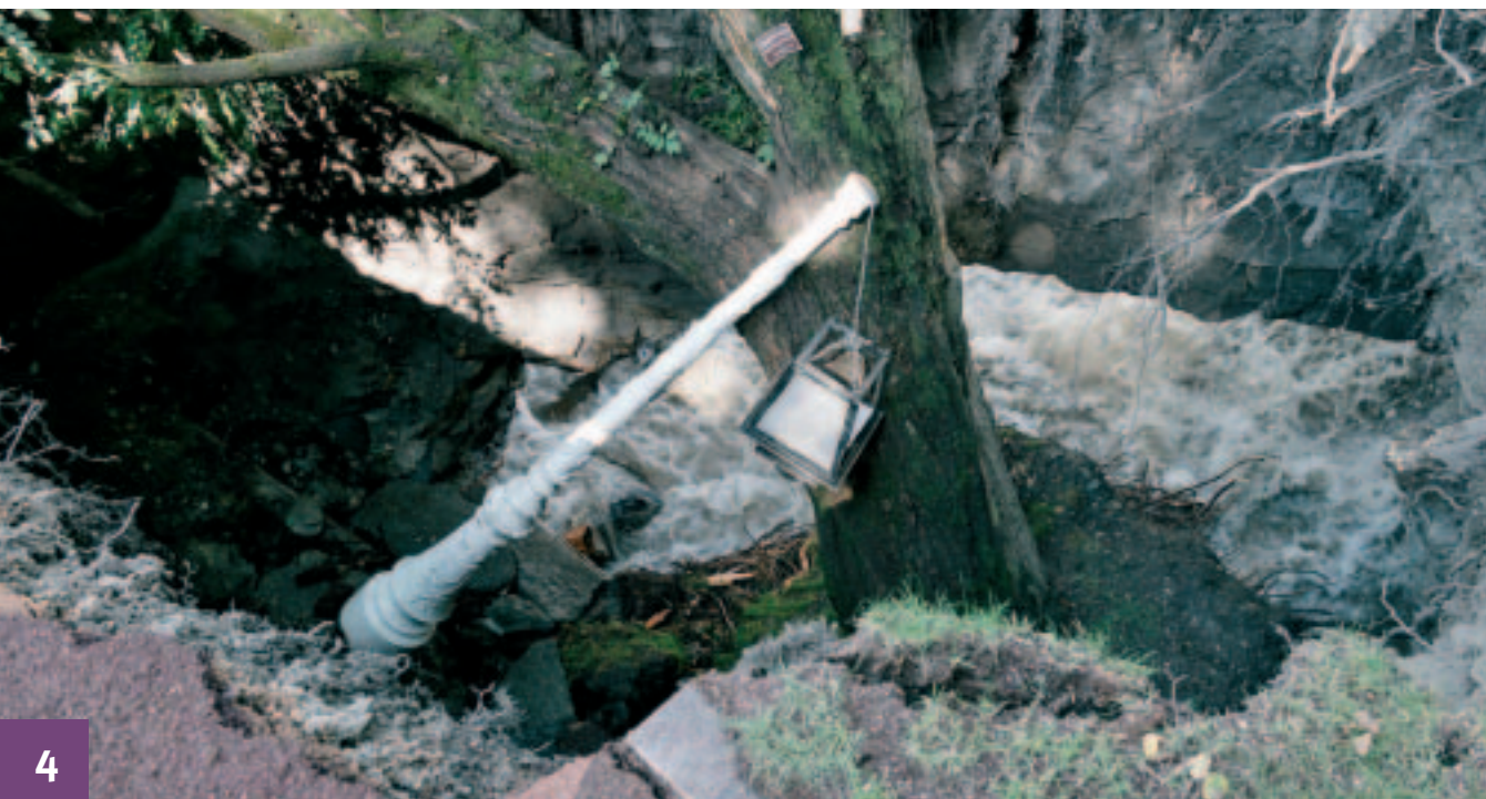
3 Allevard Place de Verdun