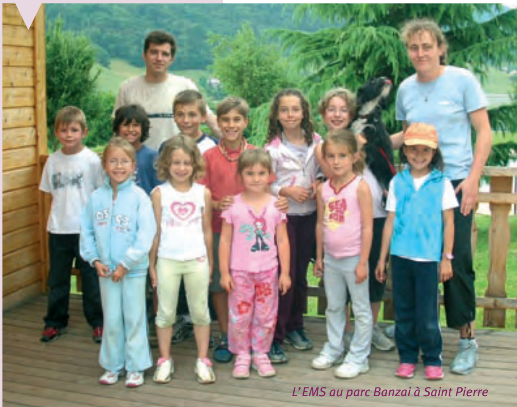
L'EMS au parc Banzai à Saint Pierre