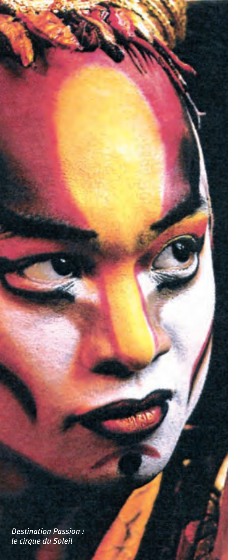
Destination Passion : le cirque du Soleil