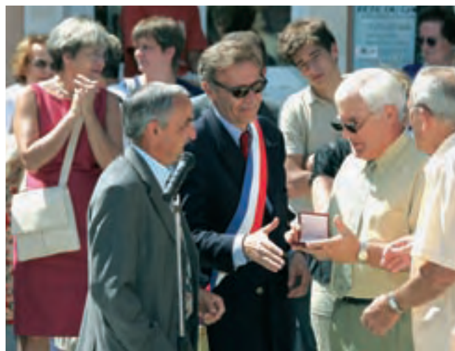
Remise de médaille à l'amicale des donneurs de sang